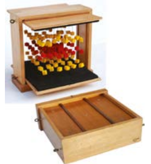
SPAZIO-ELASTICO | 1960 Progetto per ambiente