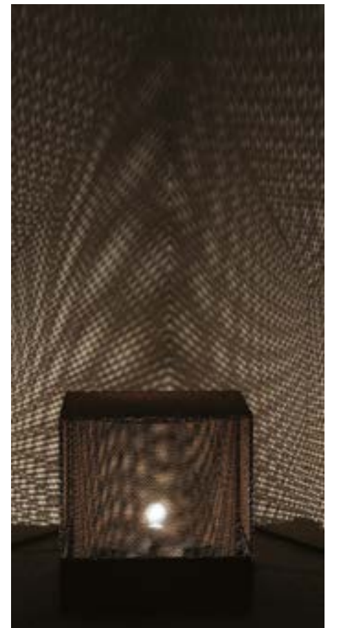
PROIEZIONE DI LUCE E OMBRA | 1961

Quando c'è innovazione, c'è arte; e l'innovazione tecnologica dei nostri giorni permette di vedere e di apprezzare questo nuovo tipo di arte, tant'è che i giovani sono convinti che queste opere appartengano a un tempo recente, mentre in realtà hanno oltre 50 anni".