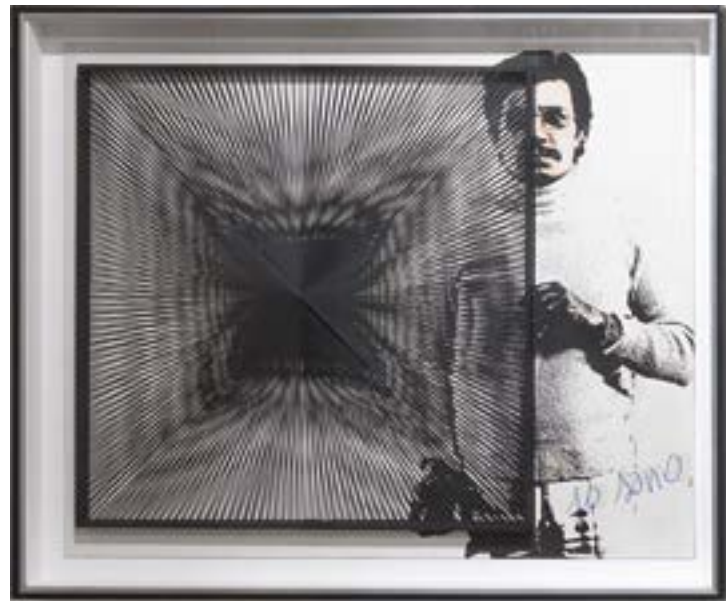
IO SONO, TU SEI, EGLI È... PARTICOLARE DI IO SONO | prima realizzazione nel 1972