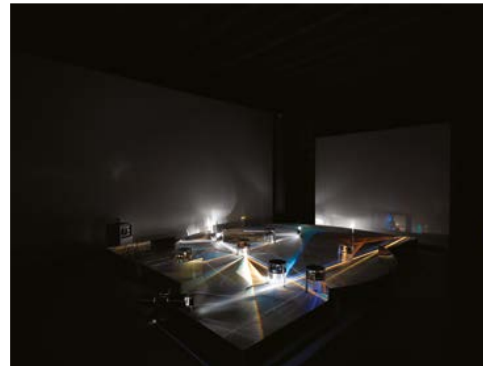
LIGHT PRISMS - GRANDE TUFFO NELL'ARCOBALENO | realizzazione in scala nel 1962

Nel '61 aveva aderito al movimento Nuove tendenze e nel '62, come Gruppo N , con Bruno Munari, Enzo Mari e il Gruppo T , partecipa alla fondazione del movimento dell' Arte Programmata . Scioltosi nel 1966 il Gruppo N , l'attività artistica di Biasi prosegue in "a solo" sviluppando quei temi che resteranno una 'felice ossessione' fino ad oggi.