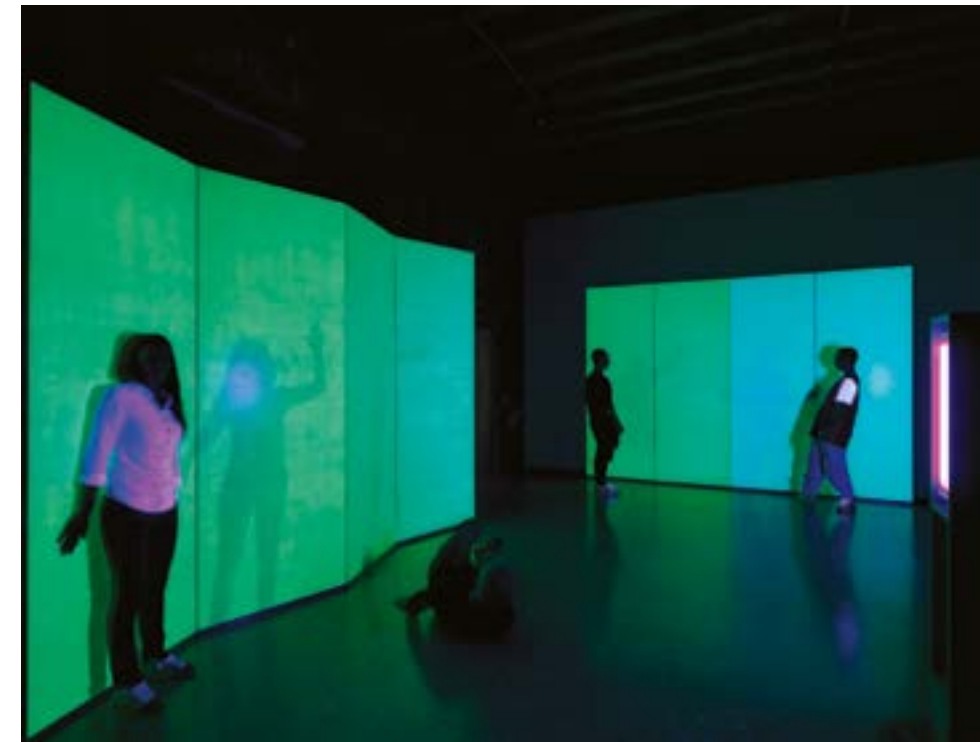
ECO | prima realizzazione nel 1974

Strati fluorescenti e oli in contenitori calpestabili di polietilene trasparente