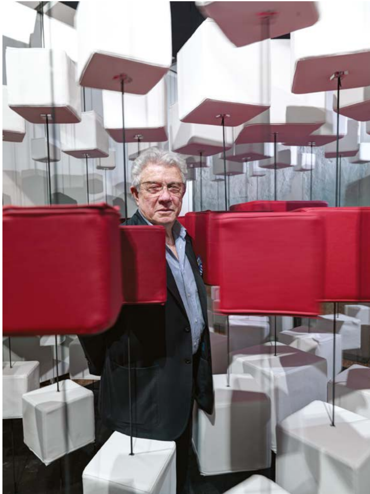
SPAZIO ELASTICO | prima realizzazione nel 2016