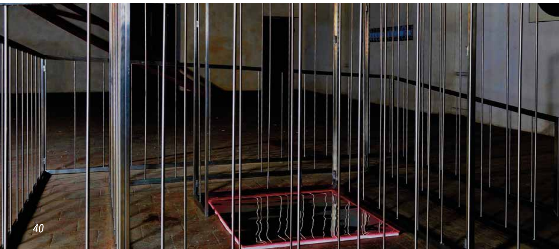
/ A /