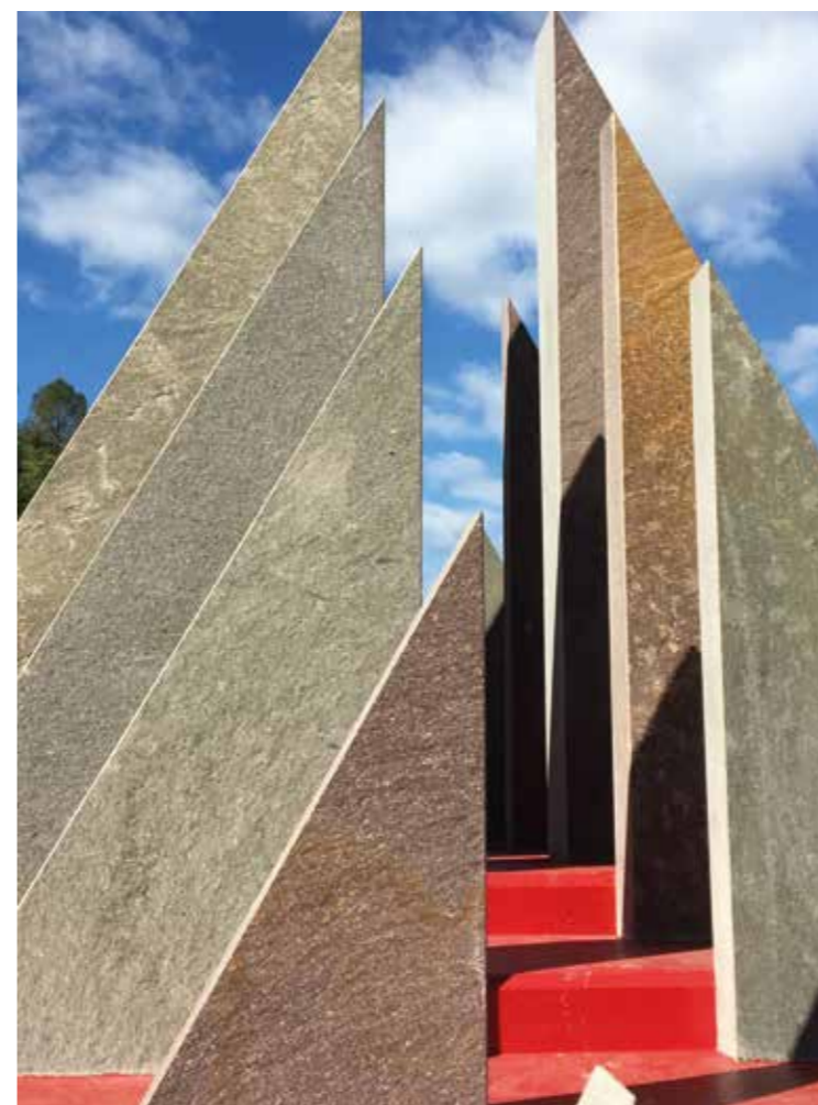
/ B /

Coerente, ma sempre capace di rinnovarsi e di sperimentare, la sua creatività si esprime attraverso vari materiali: dalla pittura alla scultura, passando attraverso la vetrofusione, la lavorazione della ceramica, la fotografia, la video art, i libri d'artista, ma anche la Mail Art, la poesia visiva, l'illustrazione di composizioni haiku o raccolte di liriche, collaborando con poeti come Andrea Zanzotto e Edoardo Sanguineti.