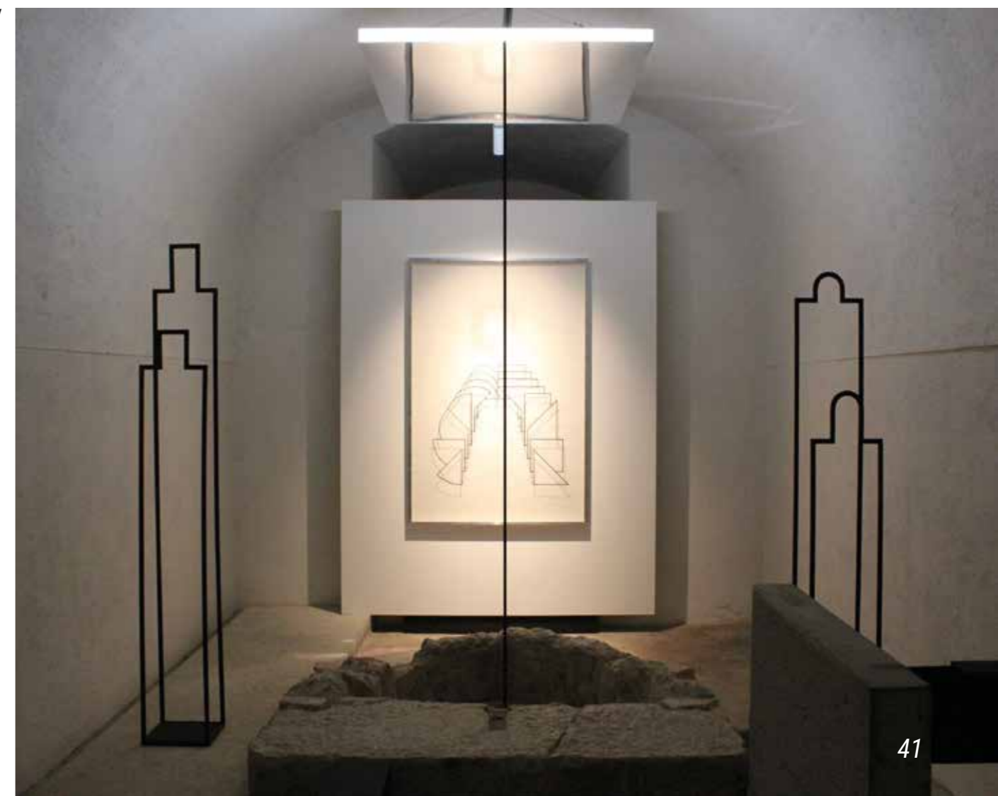
/ C /