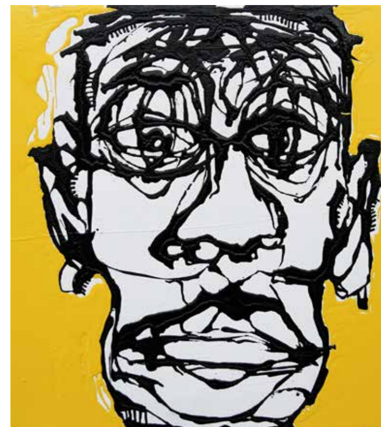
C / SENZA TITOLO 02 / 2012 acrilico su tela - acrylic on canvas - 28cm x 30cm